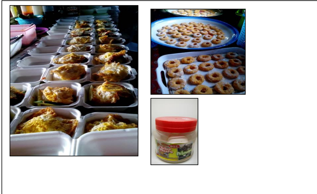
Caption : Pertambahan permintaan terhadap produk makanan nya apabila promosi yang dibuat berjaya.