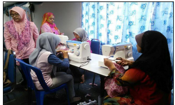
Caption : Beliau juga mempunyai minat yang mendalam terhadap industri tekstil dan jahitan. Beliau merancang membina sebuah butik pakaian pengantin di samping menambah pendapatan dan peluang kerjaya kepada masyarakat setempat.