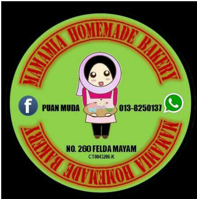
Caption :Mempelajari Teknik membuat video menggunakan aplikasi Movie Maker serta membuat logo perniagaan